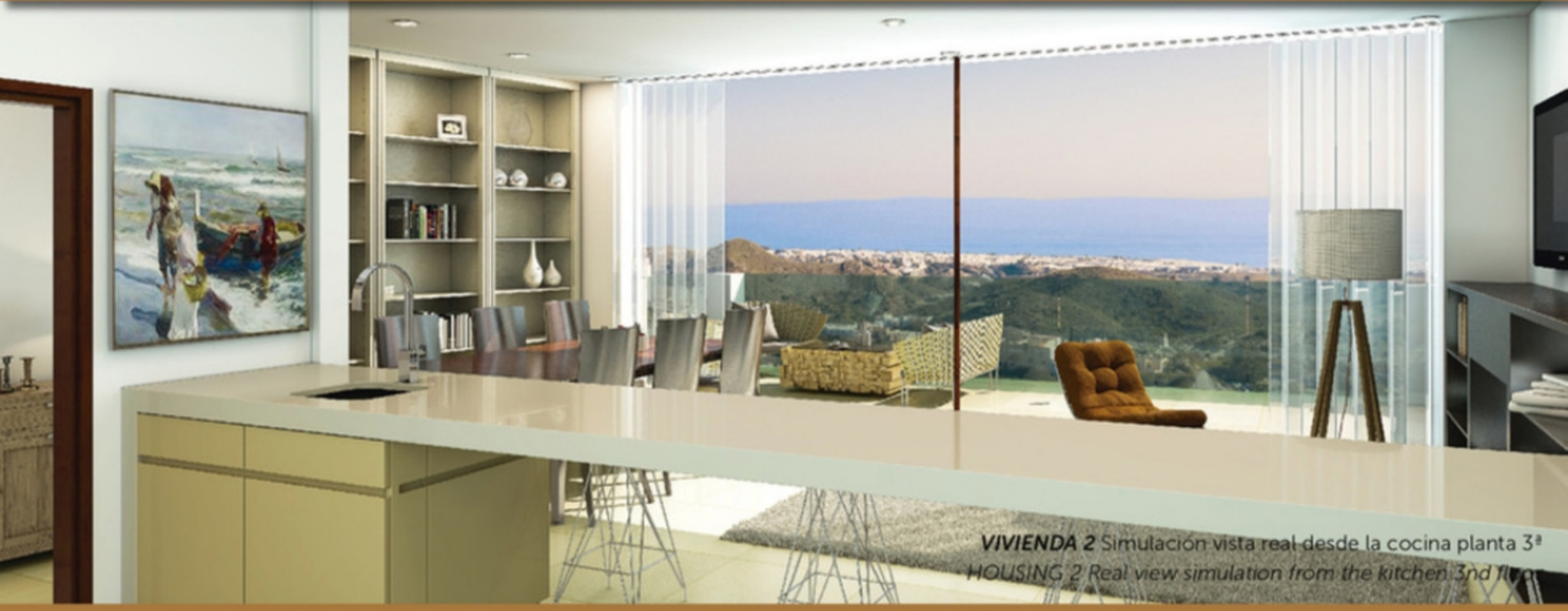
VIVIENDA 2 Simulación vista real desde la cocina planta 3ª HOUSING 2 Real view simulation from the kitchen 3rd floor